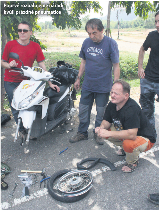
Poprvé rozbíjíme nářadí kvůli prázdné pneumatice