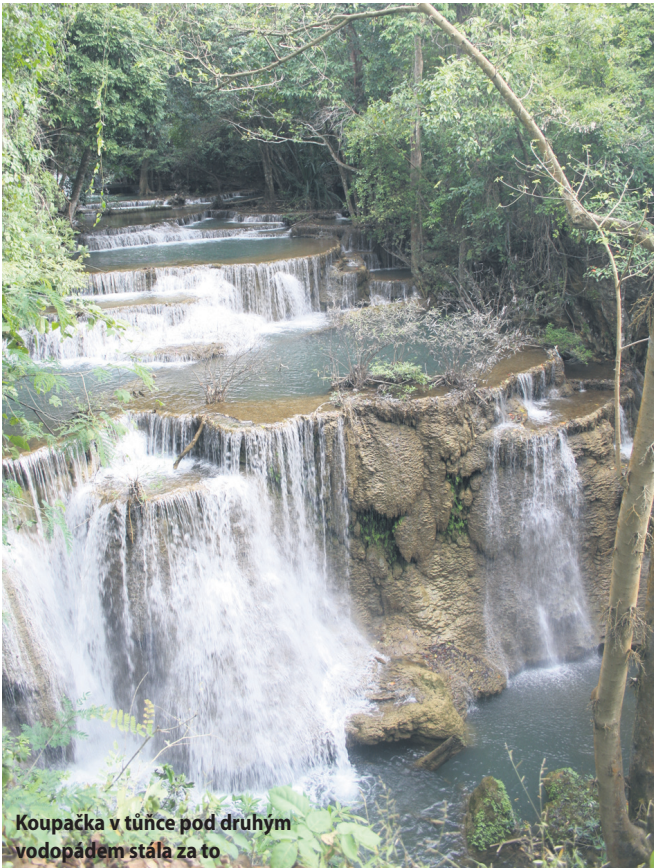
Koupačka v tůňce pod druhým vodopádem stála za to