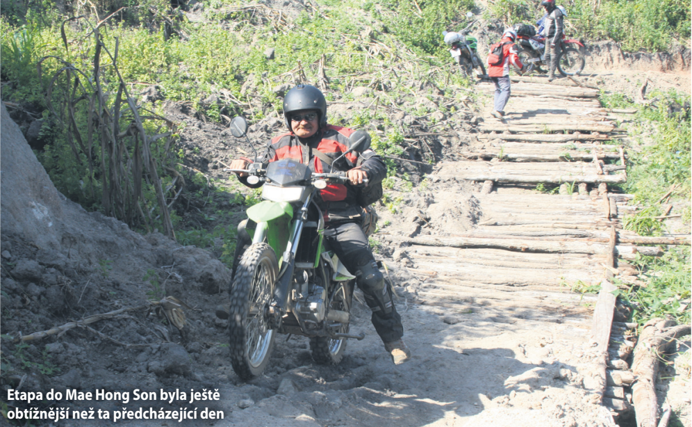
Etapa do Mae Hong Son byla ještě obtížnější než ta předcházející den